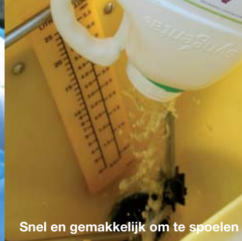
Snel en gemakkelijk om te spoelen