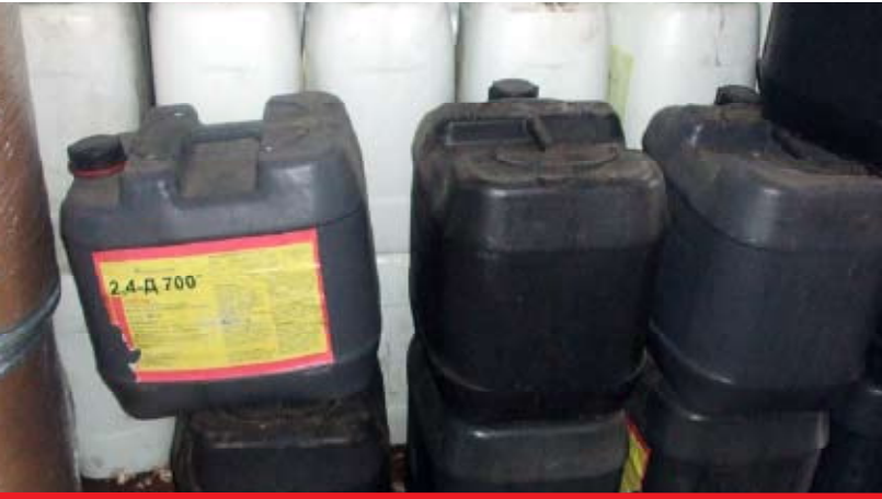
Illegaal gekopieerd etiket