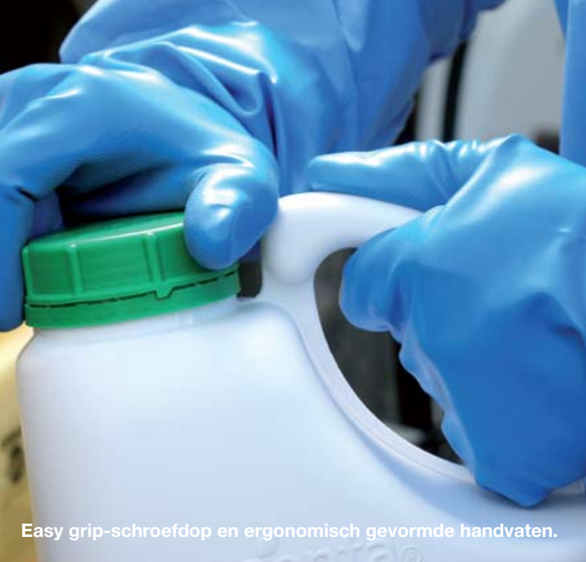
Easy grip-schroefdop en ergonomisch gevormde handvaten.