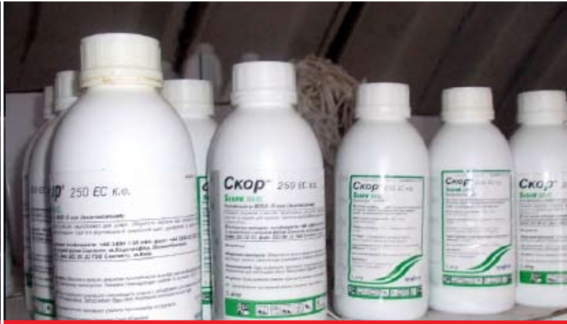
Opgeslagen lekkend illegaal gekopieerd product