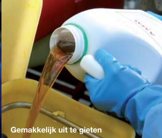
Gemakkelijk uit te gieten