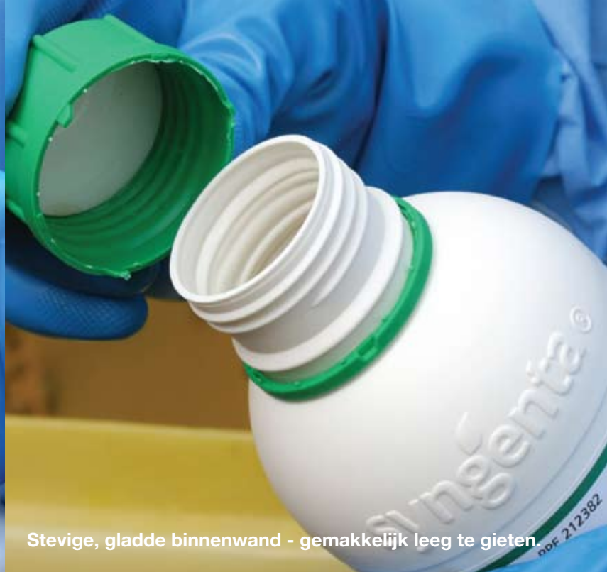
Stevige, gladde binnenwand - gemakkelijk leeg te gieten.