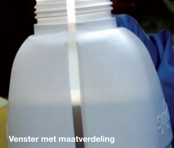
Venster met maatverdeling